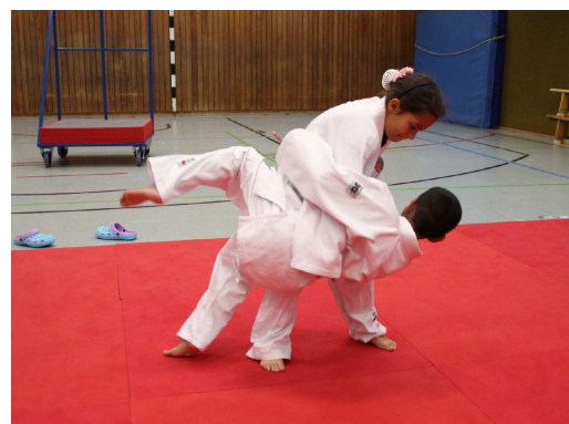
O-goshi - Uke wird dabei über Toris Hüfte geworfen